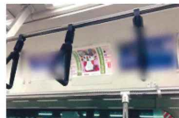
ポスター掲出例(車内広告)