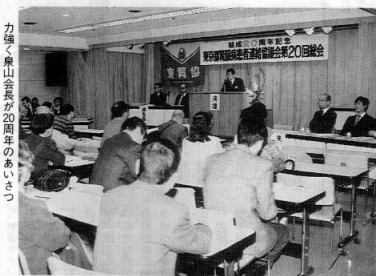
力強く泉山会長が20周年のあいさつ

の二、三千人の患者が今は平成二年末では十万人時代を迎えています。患者が多くなることは生命が助かることではない