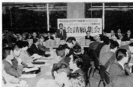
患者の願いを込めた署名を前に