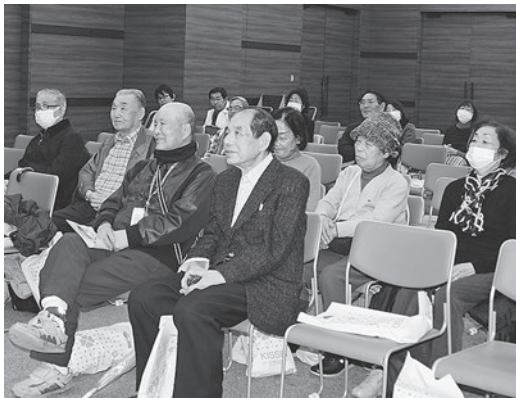
災害対策セミナー

昨年引き続き練馬腎患者ネットワークでは、災害対策セミナー(Ⅱ)を2月20日(土)に練馬ココネリホールで開催しました。当日は天候も悪く、土曜日開催でしたので参加者は東腎協関係者4名、武蔵野総合クリニック練馬医師2名、練馬地区5患者会32名、他区患者会4名、一般参加者5名の総勢47名でした。機関誌「とうじんきょう」冬号の予告記事を見て参加してくれた方もいましたので其れな