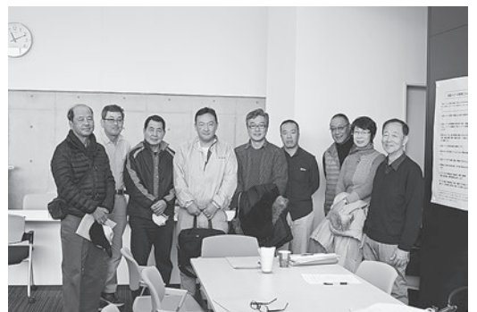
練馬送迎協議会設立

最後にセミナーで使用した資料等がありますので、今後の患者会の交流会で活用して頂ければと思います。東腎協の事務所に連絡を頂ければ送付いたします。 災害時の送迎の足 透析患者の送迎は週3回、生活のリズムになつていふと言うより体力的にも精神的にも負担が多くなつています。それでも平常時ならばほとんどの透析施設が送迎を無料でしてくれていますので安心