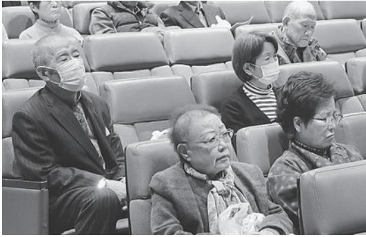
熱心に話を聞く参加者