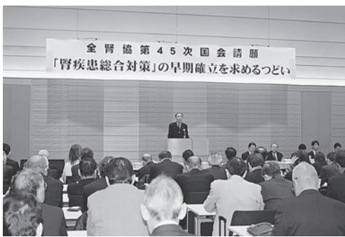
全国から集まった代表者たち

とが大切だと教えられました。賛助企業からの「レタス」「ドリンク」を手手に、参加者は納得したように帰られました。