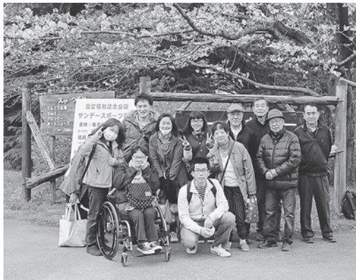
満開の桜の下で記念写真

に言われてきた人も、今日だけは羽目はずしと、つつい。盛りだくさんのお肉、野菜、焼きそばとビールに日本酒をたっぷり堪能して、約3時間の宴を満喫して桜満開の公園を後にしました。