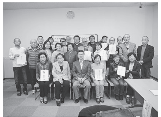
東部ブロック正会員交流会

昼食会の前にブロック長挨拶、会議内容、参加者の自己紹介をしました。13時から会議開始、戸倉副会長進行のもと第一部では、28年度東部ブロックの予定としまして交流会、イベントの企画を参加者の皆様と話し合い余った時間で会員拡大、患者会の現状報告など