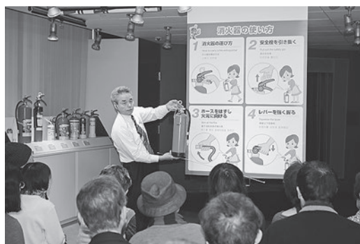
中南部会員交流会

強。映像視聴では、災害時の危険性や判断の大切さを学んだ。その後場所を移しフリートークの時間を設け、災害時の各病院での対応方法、居住区の対応方法や日頃の悩みについて情報交換やアドバイスをを行い終了した。