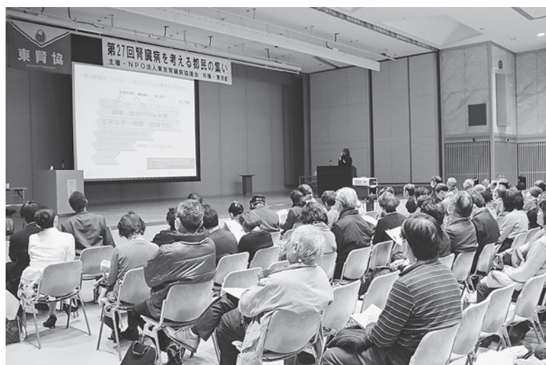
熱心に話を聞く参加者

A. リンはたんぱく質の多い食品(肉・魚・卵・乳製品・豆類など)に多く含まれます。たんぱく質を控えることでリンの摂取量を