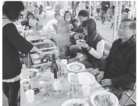
バーベキューで盛り上がる