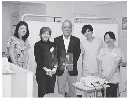
南青山クリニック学習会

人の考え方など幅広く意見交換されました。勉強会終了後には、チーリップの会に2名新規加入して頂きました。