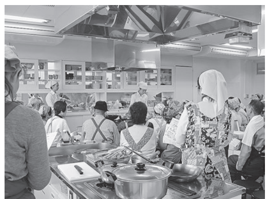
清湘会の「料理講習会」

①の調理実習は、減塩や簡単な調理方法の工夫を紹介しながら1食の塩分1・5g以下の透析食を