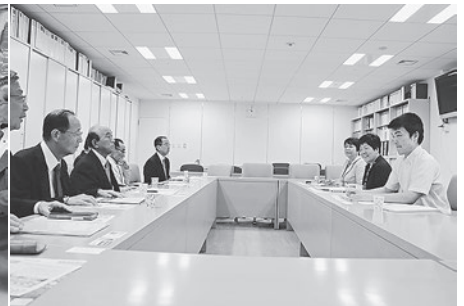
日本共産党東京都議団