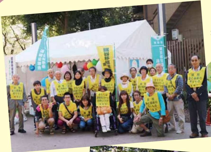
第35回臓器移植普及キャンペーン (左) 井の頭恩賜公園会場