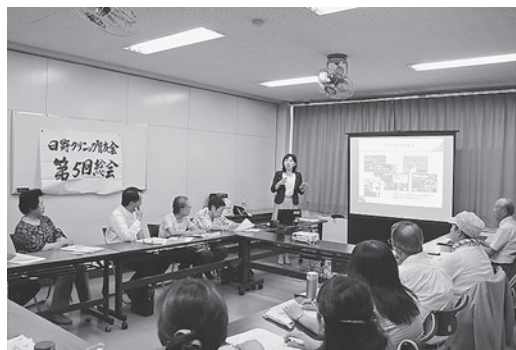
日野クリニックの「総会と学習会」

学習会には、初めて参加の会員さんや豊田クリニックからも参加いただき、多くの質問や意見も出され有意義な勉強会になりました。会場の準備が悪く(空調があまり