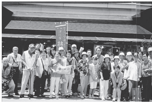
桑の実会「日帰りバス旅行」

古志産の錦鯉に心を洗われ、日本のボスになった気分での記念の写真を撮る。カニ尽くしと甘エビ食べ放題の昼食に、満足する。雪国マイトケ館で大きなおきな株を土産にして、エリンギの摘み取りは、初めての体験でした。その後は三国街道・塩沢宿の牧之通りへ、全国有数の豪雪地で江戸と越後を結ぶ宿場町として栄え、また織物の産地として発展したところで、地域の人たちが昔のたたずまいを再現し(電線等は地下に潜らす)、雪国特有の雁木の並木に見とれる一時でした。チケットを渡させ順次消化して、暑い街並みを散策するも、来るならやはり今ではなく秋でしょう。そして魚野の里・魚